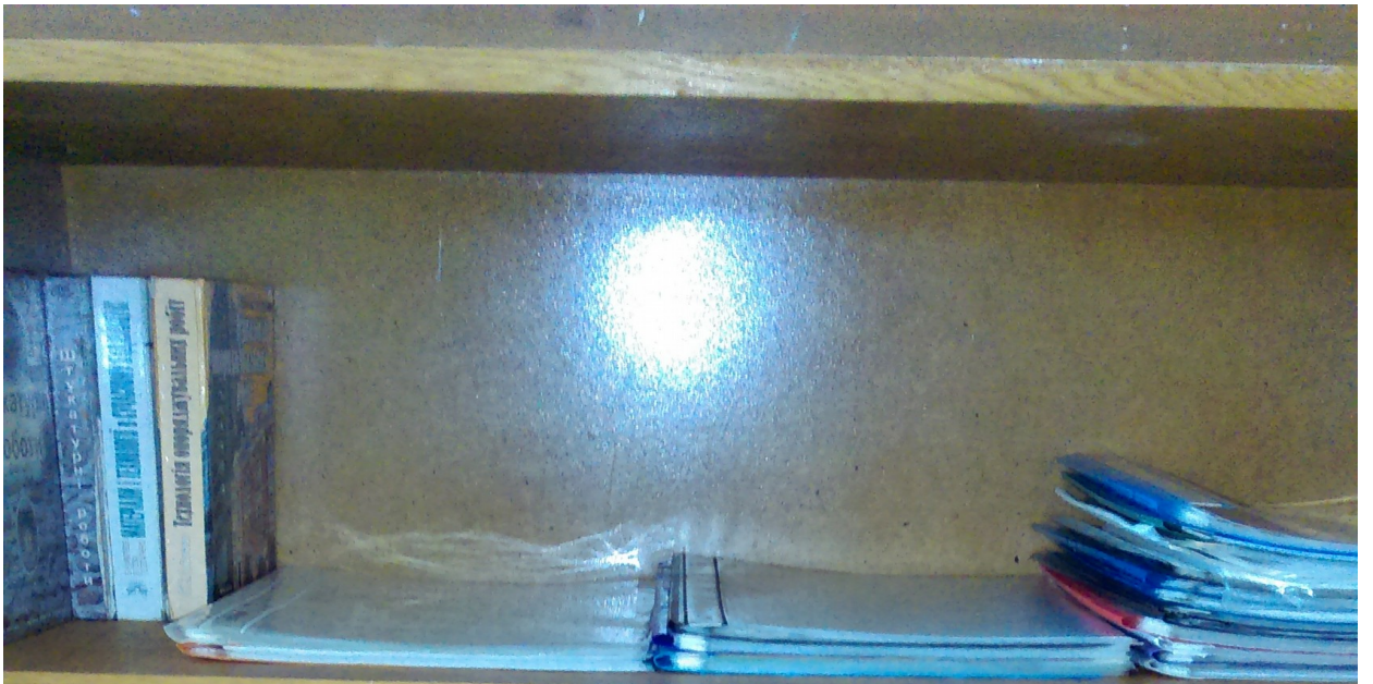
Українська історія України