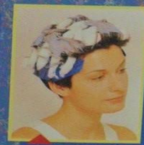
Пасма горизонтальним пролізом